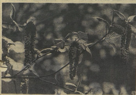
«ВЕСЕННИЕ ЗАБАВЫ». Снимок Алёши Смодина. Дом юных техников, г. Магнитогорск. «ВЕСНА ПРИШЛА». Снимок Коли Шестинцева. Двор пионеров, Москва. «ПО БОЛЬШОЙ ВОДЕ». Фото Валерия Пустовалова, Москва.