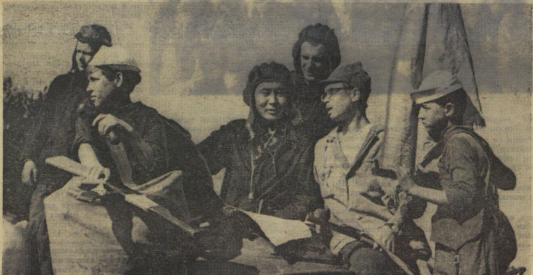
Солдаты зачехлили пушки, чтобы больше никогда не гремели взрывы. Чтобы через много лет другие мальчишки могли ходить на рыбалку, загорать на солнечных полянках. Когда мальчишки и солдаты живут в дружбе, то получаются такие фотографии.